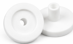
LUMINES SFERO FLEX end cap with hole LUMINES SFERO FLEX zaślepka końcowa z otworem