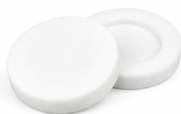
LUMINES SFERO FLEX end cap LUMINES SFERO FLEX zaślepka końcowa